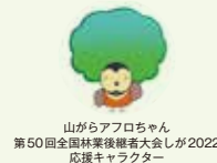
山からアフロちゃん 第50回全国林業後継者大会しが2022 応援キャラクター