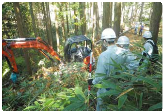
森林作業道作設実習