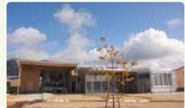
会場：多賀中央公民館 多賀結いの森