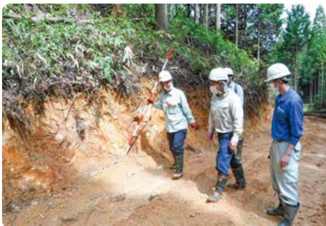
既設作業道見学実習