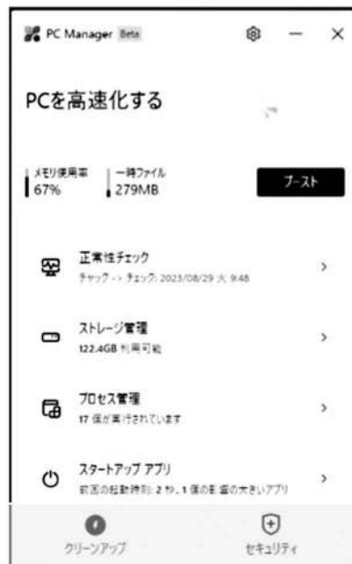
図1 PC Manager 起動

[ブースト] ボタンをクリックすると図2になります。メモリ使用率は 57% に減少、一時ファイルは 0KB になっていて、タイトルは「パフォーマンスが向上しました」となっています。「向上しました」と言われても体感的には変化在りません。向上前もストレスなく使っていました。今回ブースト後には、たまたまメモリ使用率は 57% もありましたが、今までの最低は 42% 程度でした。